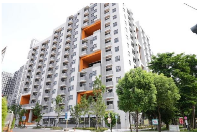
員和青年社會住宅

為扶植與培育優質創業團隊，新北市政府青年局（下稱本局）運用土城區員和段青年社會住宅公益空間打造土城綠創基地(土城區莊園街 151 號 2 樓)，招募具綠能減碳、環境永續、循環經濟等具綠色創新特色之相關技術、產品、服務或構想之新創團隊進駐基地，提供辦公空間、業師輔導、創業課程等資源，協助新創團隊進行市場驗證、商機合作鏈結、促成募資及加速事業發展，活絡新北綠色永續創新產業發展。